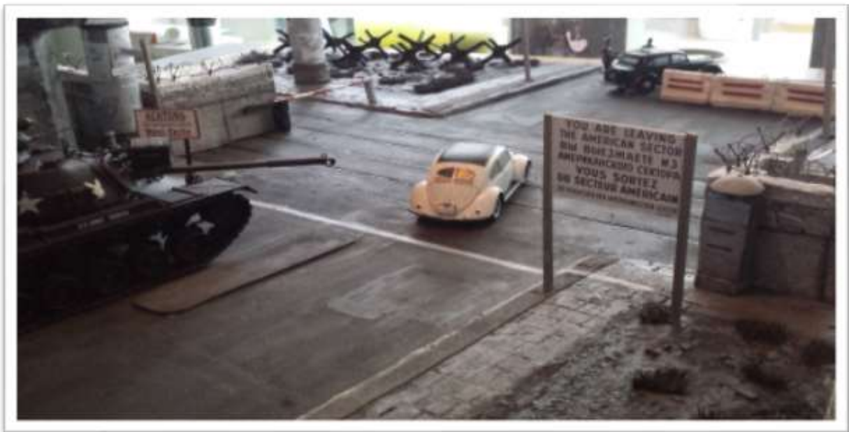
Checkpoint Charlie, Koude oorlog. Schaal; 1;35

Diorama's van verschillend formaat nemen jong en oud mee in de geschiedenis van het leger in de 19 e en 20 e eeuw